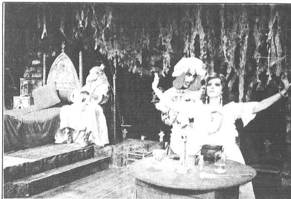
Una escena de "El desván de los machos", que se estrena este jueves.