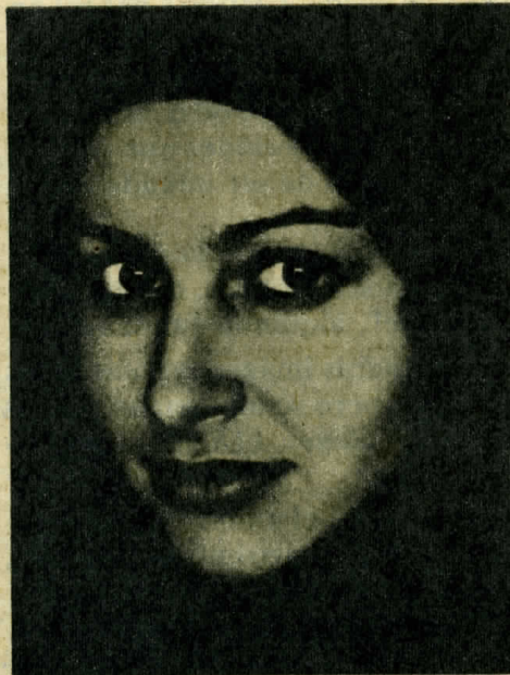
Mujer con chador: en una mirada puede estar la otra desnudez

retratos casi no utilizan efectos técnicos especiales, con excepción de algún encuadre abstruso o del empleo de un filtro azul para una foto que, con él, se carga de melancolía, frío y soledad. Su virtud radica en la esencialidad de las formas, en la desnudez documental con que se aplican a cuerpos y rostros, como buscando ese otro desnudo, el de más allá de la piel.