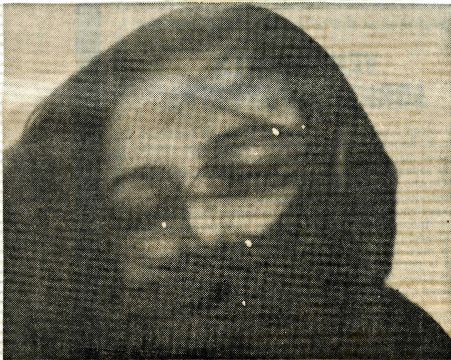
Una mujer, de Sergio Marras.

SERGIO MARRAS , fotógrafo, sociólogo y periodista, está exponiendo sus fotografías en el Instituto Chileno-Británico desde el 14 de mayo. La exposición, llamada "Mujeres", es una muestra subjetiva sobre la mujer de España, Inglaterra, Argelia, Turquía, India, Nepal, Tailandia, Marruecos y Chile. La exposición permanecerá abierta hasta el 13 de junio (Miraflores 123).