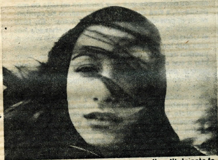
■ “Retrato en los mares de Dinamarca” se titula esta fotografía captada por Sergio Marras.

La muestra permanecerá abierta hasta el 13 de junio, en Miraflores 123, entre las 10 y las 12 del día y desde las 17 a 20 horas.